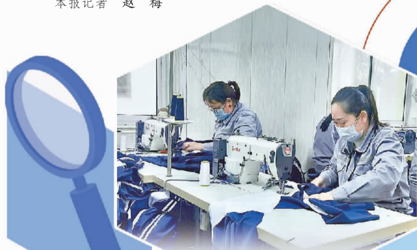
甘肃天祝县华藏寺镇村民在东西部协作援建的就业帮扶车间务工。

今年以来,甘肃全省58个受援县5.76万名农村劳动力实现转移就业,较去年同期增长82%,其