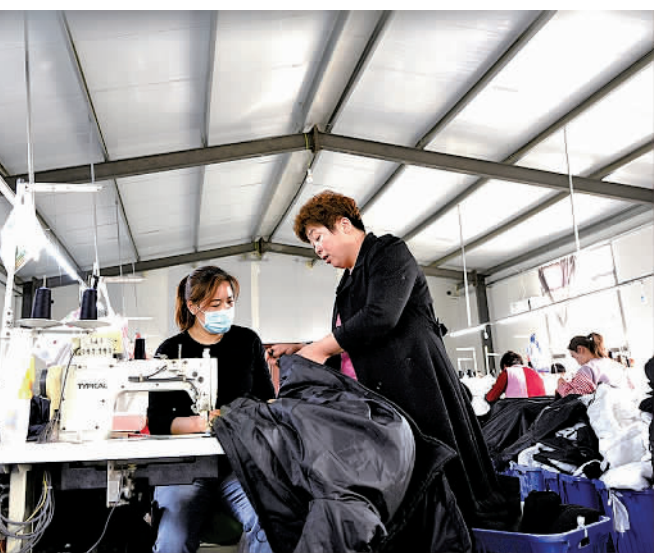
5月5日,位于山东省阳谷县李台镇路庄村党支部领办的羽绒加工车间,工人们正忙着赶制服装出口订单。近年来,阳谷县通过“党支部+返乡创业能人+党员服务+群众参与”模式,发展小微企业,带动农村妇女实现家门口就业增收。

坚持纪律挺先,让干部行有所畏。容错和“撑腰”绝不是纪律松懈,应以有效监督激励干部担当作为。通过聚焦重点工作监督执纪,围绕重点区域督查检查,强化群众、舆论、社会等“一线”监督方式,坚持正向激励与负向激励相结合,向“不作为、慢作为、乱作为”开刀,激发干部队伍的内驱力。