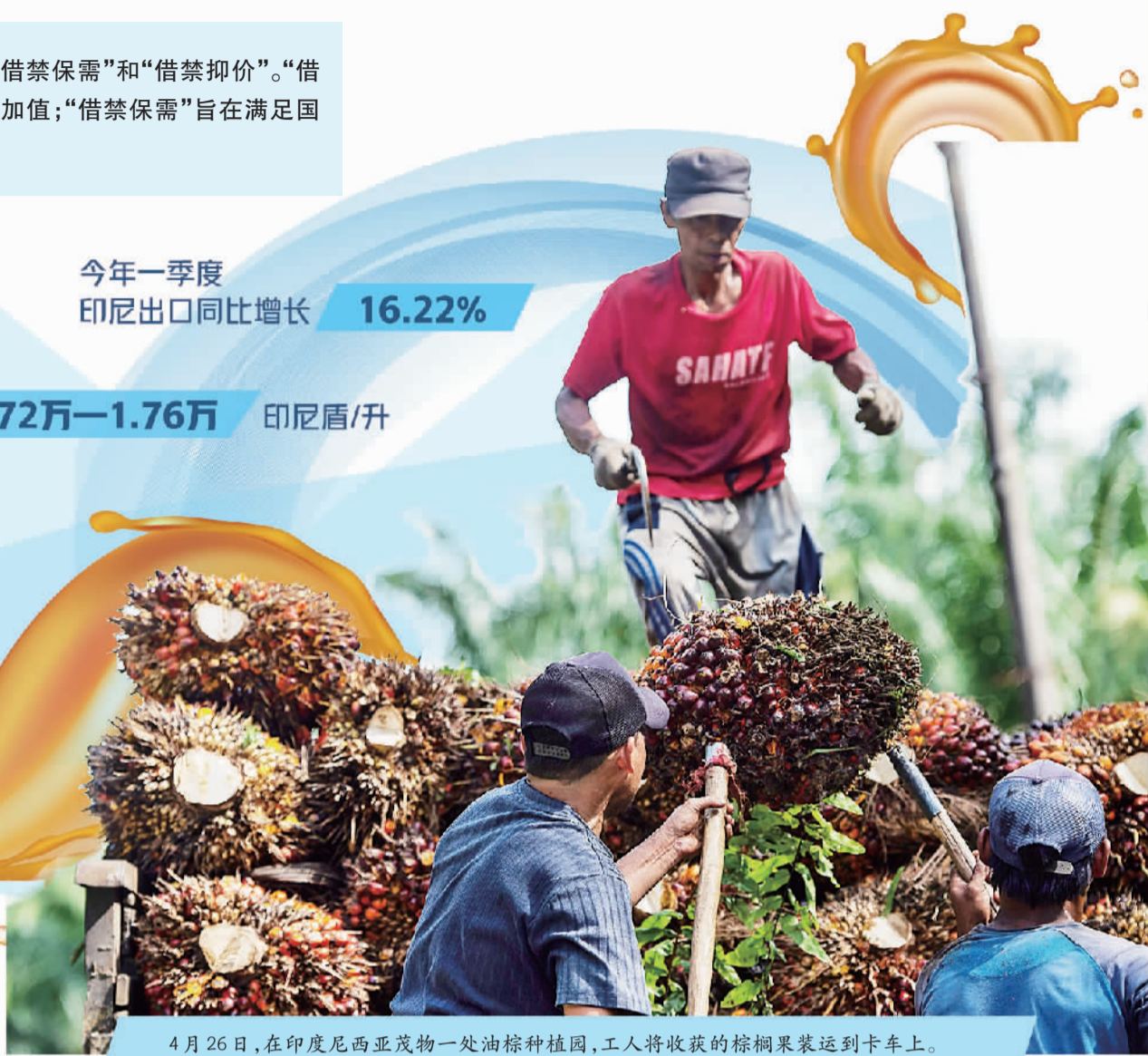
4月26日,在印度尼西亚茂物一处油棕种植园,工人将收获的棕榈果装运到卡车上。

印尼“棕榈油出口禁令”的收放随国内形势变化的痕迹明显。在4月24日宣布禁令之前,印尼国内发生了今年以来的首次抗议活动,其诉求包括降低“食用油价格”等。在5月19日宣布取消禁令的前两天,印尼油棕农户举行抗议,呼吁取消禁令,并准备再次组织示威。根据报道,“棕榈油出口禁令”最终并未能使市场上的散装食用油价格降到政府期望的水平,但却给近1700万油棕农户造成经济困难,由于价格被压得过低,他们甚至无法收回成本。