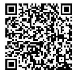
视频报道请扫二维码

无论是走轻资产还是数字化转型,如何以更低的成本提供优质的办公场所和便捷的服务,将成为共享办公企业扭亏为盈、迎来柳暗花明的关键。