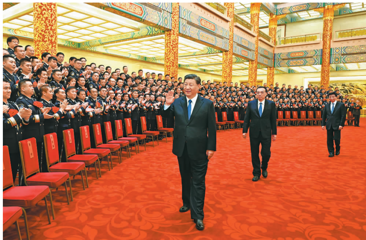
5月25日,党和国家领导人习近平、李克强、王沪宁等在北京人民大会堂会见全国公安系统英雄模范立功集体表彰大会代表。

新华社北京5月25日电 全国公安系统英雄模范立功集体表彰大会25日上午在京举行。中共中央总书记、国家主席、中央军委主席习近平亲切会见会议代表,向他们表示热烈祝贺,向全国广大公安民警辅警致以诚挚问候。