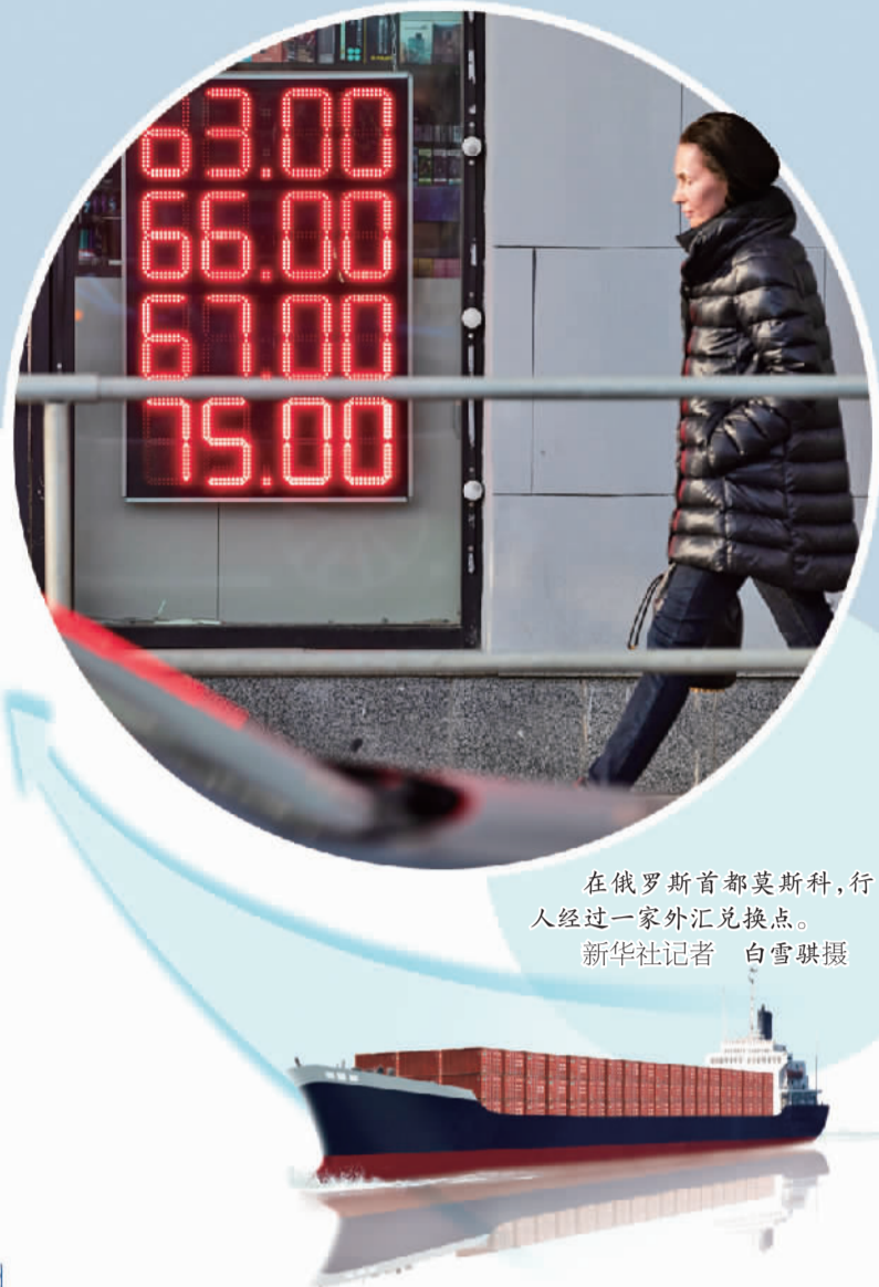
在俄罗斯首都莫斯科,行人经过一家外汇兑换点。

实施进口替代对俄意义重大,无论是官方还是学界已经达成共识。需要指出的是,一方面进口替代并非所有行业的完全替代,正如俄工贸部长曼图罗夫称,俄有兴趣参与全球产业链和全球合作,俄没有进口替代所有产品的任务;另一方面进口替代不能一蹴而就,国家杜马经济政策委员会副主席杰里亚金表示,进口替代不是民众所想象的规模,也不会很快速和顺利,但这一过程正在进行,国家为此分配了大量资金。