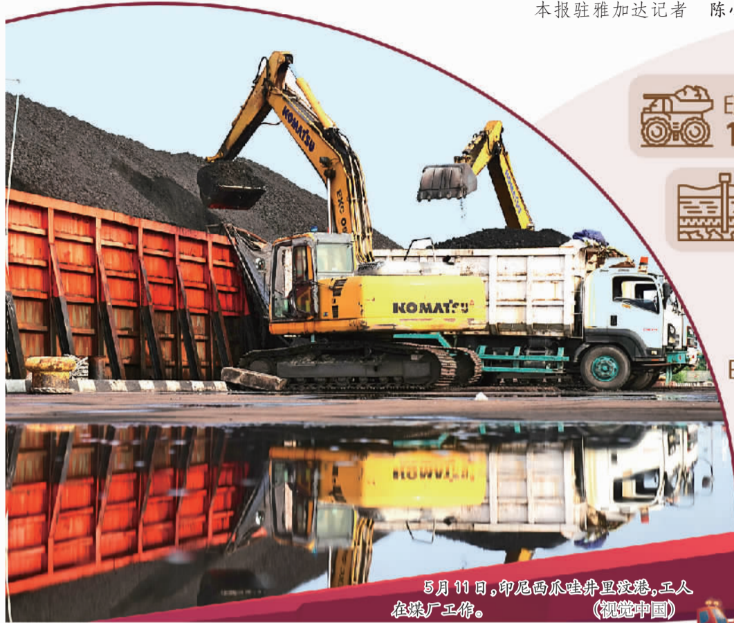
5月11日,印尼西爪哇丹里波港,工人在煤厂工作。

印度尼西亚的煤炭突然成了欧洲眼中的“香饽饽”。最近,一些欧洲国家纷纷向印尼提出了进口煤炭的想法,德国更是率先抛出了1.5亿吨的大单。在国际市场大宗商品价格持续走高的背景下,这一来自非传统市场的巨大需求对印尼煤炭业无疑是一大利好,但却并非那么简单。