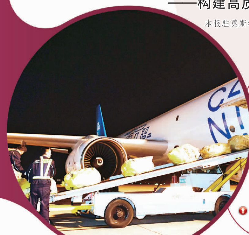
浙江杭州飞往俄罗斯莫斯科的首条直电商货航线“菜鸟号”。

近年来,俄罗斯积极发展同金砖国家良好关系,不仅在经贸方面取得积极进展,在抗击新冠肺炎疫情方面也获得巨大支持。在当下地缘政治背景下,金砖是俄参与国际事务的重要平台,俄积极评价金砖国家发展前景。