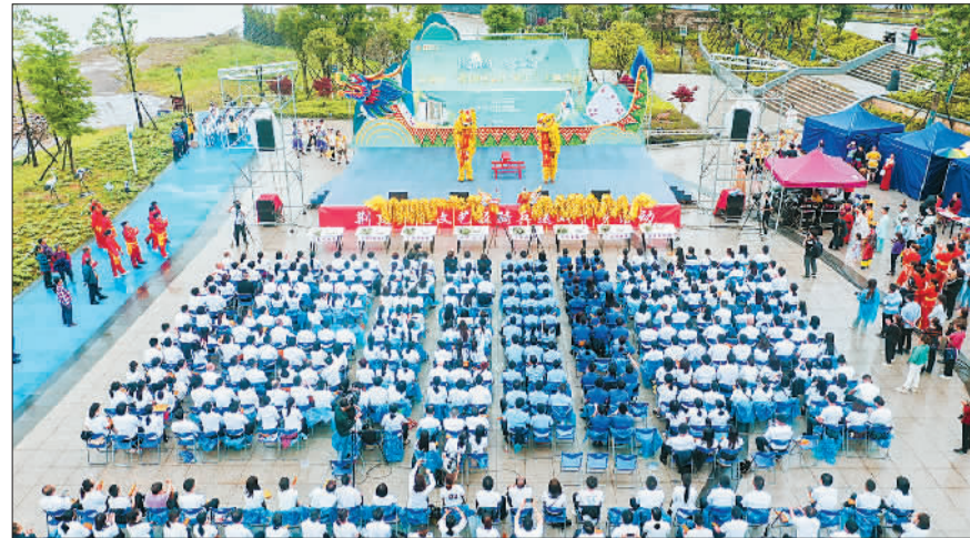
▲宜都市枝城镇朝阳广场曾是一座砂石码头,在长江岸线整治中华丽变身,成为市民休闲乐园。