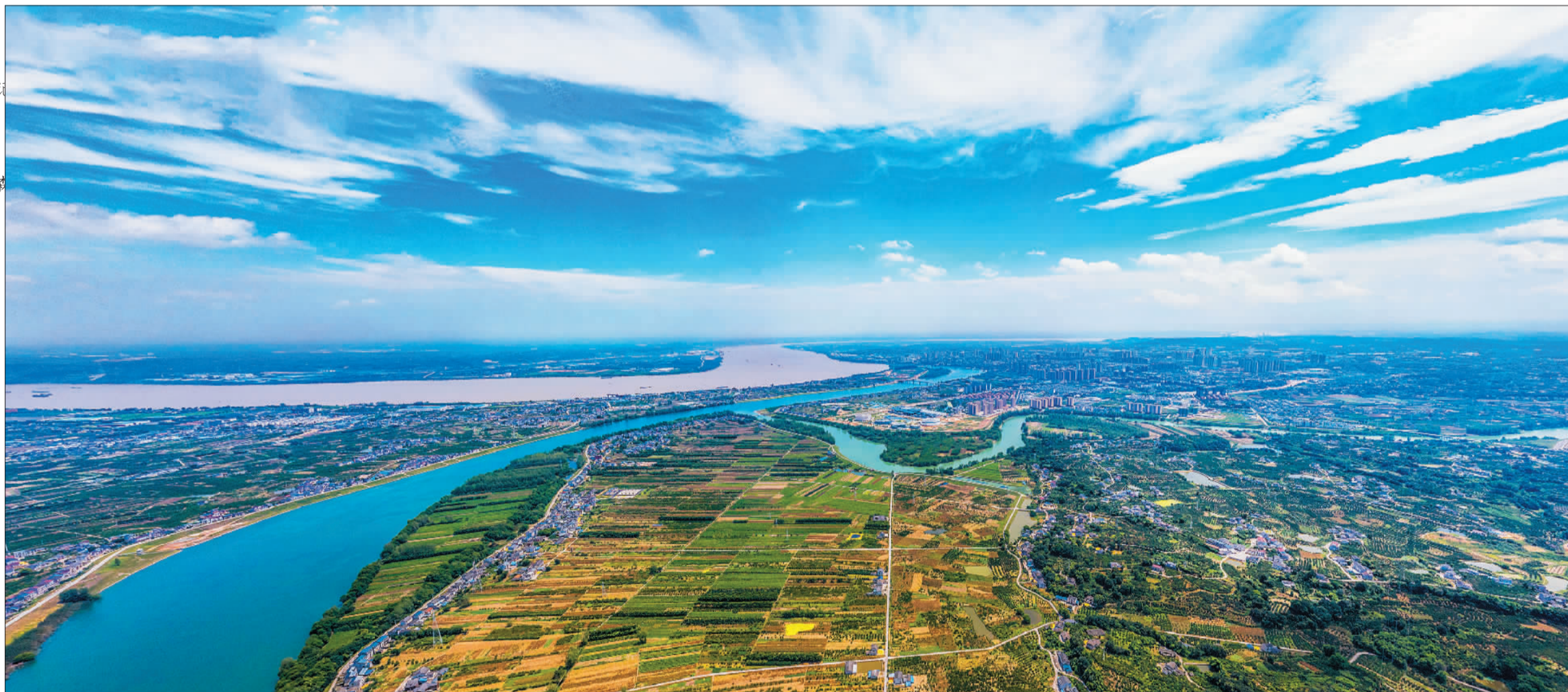
▲宜都市山水环抱,风景秀丽,长江、清江、渔洋河在这里交汇。近年来,当地坚持“共抓大保护、不搞大开发”的科学理念,努力打造绿色生态屏障,绘就宜居宜业宜游之都。