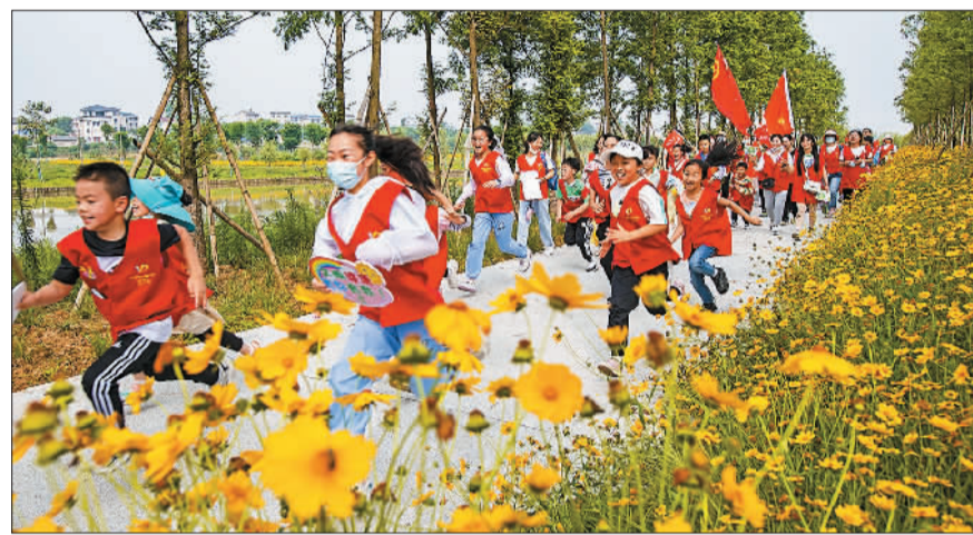
▼青少年志愿者们来到宜都市龙湖公园开展志愿服务活动。保护长江生态环境、助力生态文明建设已成为当地居民的自觉行动。