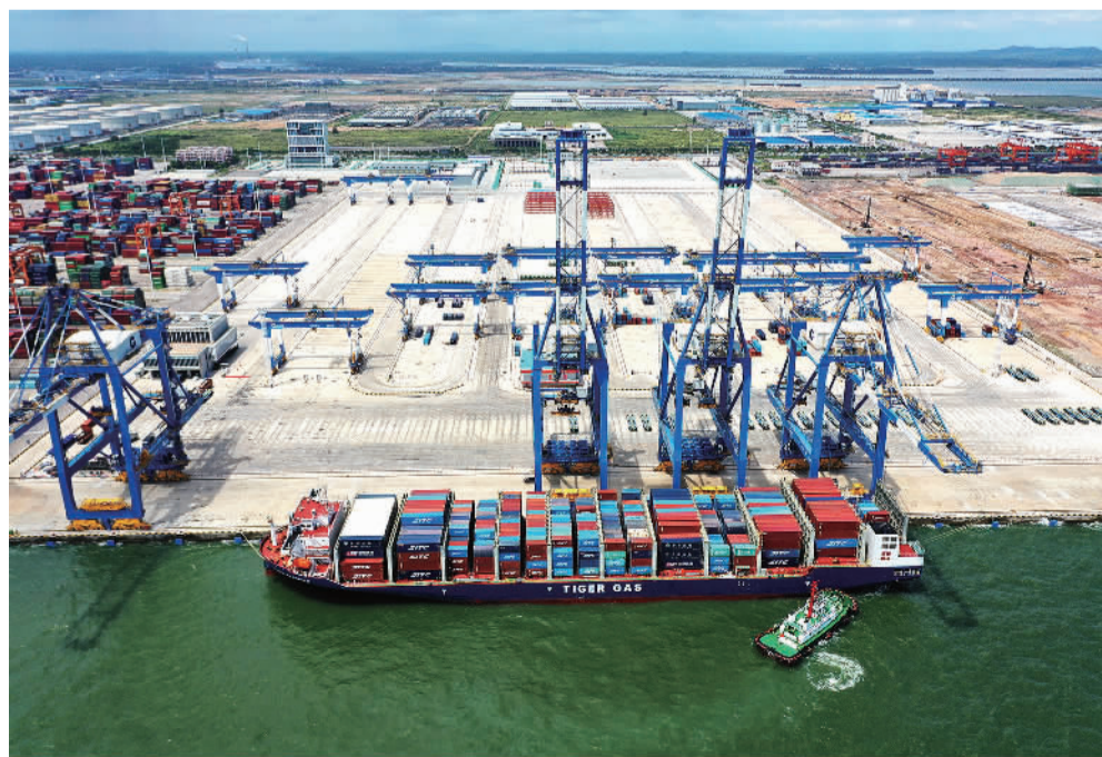
6月28日,广西北部湾钦州自动化集装箱码头正式启用。北部湾港创新应用“U”型工艺方案及技术方案,打造海铁联运自动化集装箱码头,为西部陆海新通道建设提供强力支撑。北部湾港钦州自动化集装箱码头项目按两期分步实施,此次启用的自动化集装箱泊位为一期工程,二期工程目前正在建设,将于2023年实现投产运营。

随着市场发展,打假行为的边界有待进一步厘清。针对职业打假人的牟利性打假行为,有必要从政策层面上升到法律层面,进一步健全完善相关法律法规,予以明确界定。相关部门需加强对职业打假人投诉举报的规范和引导,使其依法依规参与打击侵权假冒,发挥好遏制制假售假、净化市场的积极作用。人民法院对于消费索赔类的民事纠纷案件要加大研究,进一步统一裁判尺度,明确规则,不能“同案不同判”,存在地区差异。