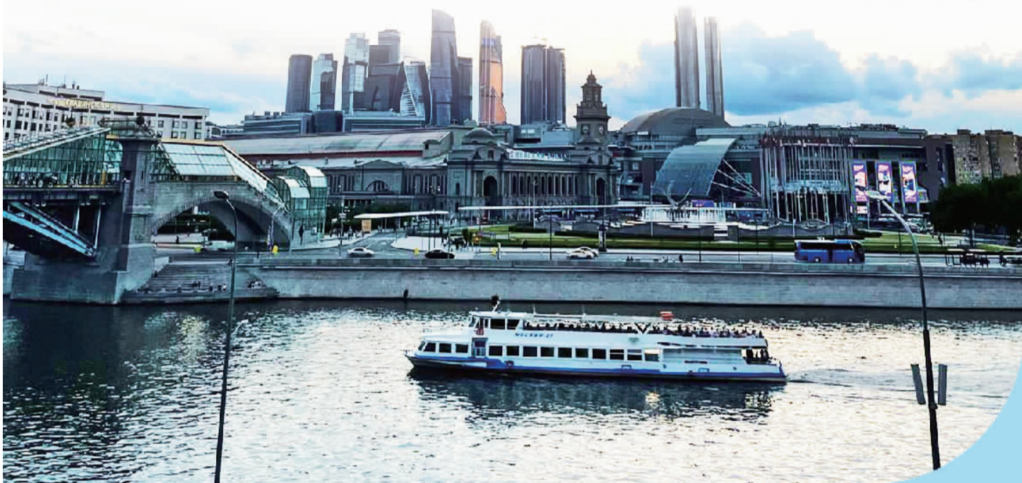
夕阳下的莫斯科商业中心。

金砖国家合作，超越了政治和军事结盟的老套路，建立了结伴不结盟的新关系；超越了以意识形态划线的老思维，走出了相互尊重、共同进步的新道路；超越了你输我赢、赢者通吃的老观念，实践了互惠互利、合作共赢的新理念。金砖国家的合作模式不仅契合五国发展需求，而且提升了发展中国家代表性和发言权，推进经济全球化与开放、包容、普惠、平衡、共赢发展，并正在推动全球治理和国际秩序朝着更加公正合理的方向发展。