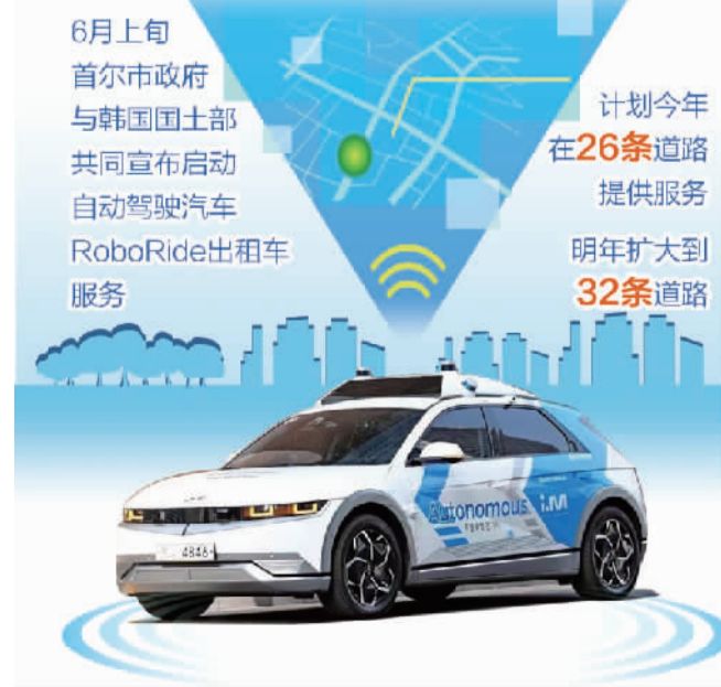
在首尔江南地区行驶的RoboRide出租车。（资料图片）

首尔市政府计划对此次示范项目运营结果进行评估，并研究把无线充电技术应用到自动驾驶汽车、共享汽车、电动公交车的方案。市政府方面称，通过无线充电技术示范项目，完成技术验证，实现技术商业化，就能解决电动公交车充电站建设问题。这有望发展成为引领电动汽车普及的新时代、实现2050年碳中和目标的核心技术。首尔市将积极支持新技术开发和普及，提升电动汽车充电便利性，把首尔打造成引领电动汽车普及的城市。