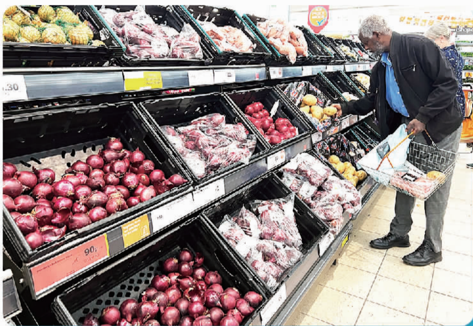
一名男子在英国伦敦一家超市内购物。

英国是发达经济体中加息抗通胀的“先行者”。面对黯淡的经济前景和不断上升的民众与企业不满、不安,英国政府显得无力与无奈。在这场发达经济体央行与失控的通胀之间的较量中,对抗通胀最有效的武器不在中央银行的职权范围内。加息无疑是一把“钝器”,或许能够通过抑制需求缓解通胀,但必然会打击大部分的中低收入家庭和工商企业。