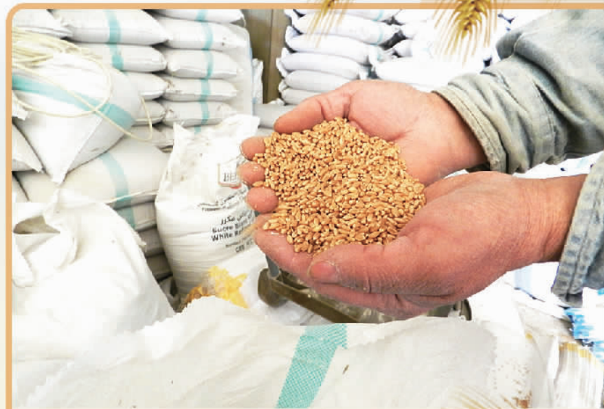
在黎巴嫩南部一处粮仓，工作人员展示来自乌克兰的小麦。

一边是堆积如山的粮食就要腐烂，一边是在饥饿中挣扎的人们，这种怪异的现象不应出现，更不应长期存在。生命至上，国际社会和有关国家需要共同努力，暂时搁置矛盾和争斗，消除一切涉及粮食出口的限制和制裁措施，尽快把堆积的粮食送到饥饿的人手上，挽救更多的生命。