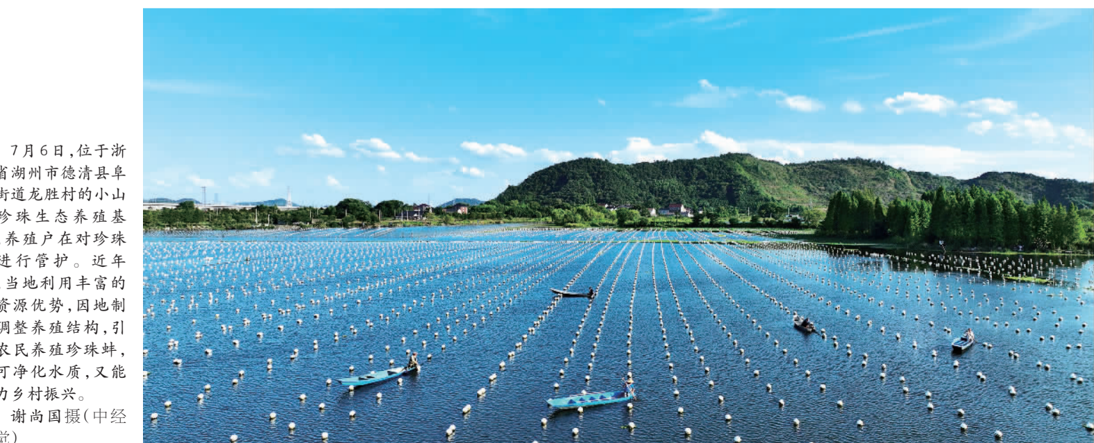
7月6日,位于浙江省湖州市德清县阜溪街道龙胜村的小山漾珍珠生态养殖基地,养殖户在对珍珠蚌进行管护。近年来,当地利用丰富的水资源优势,因地制宜调整养殖结构,引导农民养殖珍珠蚌,既可净化水质,又能助力乡村振兴。

“我们主动对标中央、省、市对人才工作提出的新理念、新战略和新举措,深入研究并积极探索,逐步构建了普惠化、立体化、智能化、精准化、全周期的‘四化一全’人才服务体