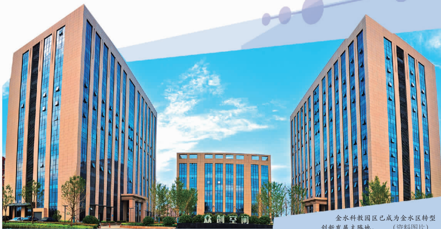
金水科教园区已成为金水区转型创新发展主阵地。(资料图片)