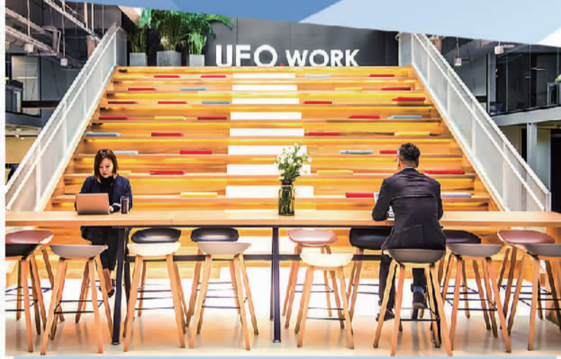
创业者在UFO.WORK提供的办公场所工作。