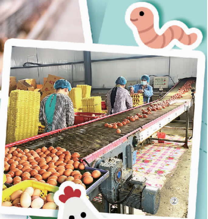
图② 辽宁合惠农业科技有限公司鸡蛋生产车间。