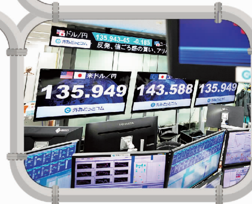
6月23日,日本东京一家外汇经纪公司的汇率显示屏。