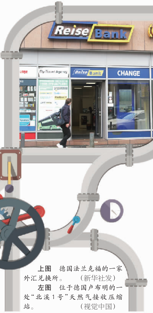
上图 德国法兰克福的一家外汇兑换所。 左图 位于德国卢布明的一处“北溪1号”天然气接收压缩站。

源供应形势,不得不对此前一系列既定能源政策进行调整,力图在继续大力发展可再生能源的同时,适当增加传统能源供应以应对能源供应紧张的形势。特别是其在一揽子计划当中大力推动风能、太阳能和水力发电的举措反映出德国对发展可再生能源、实现能源转型的坚定决心。而其中对现实情况做出的妥协也并不代表德国能源转型彻底失败。从中长期看,德国仍是欧洲乃至全球可再生能源发展的领头羊,其在全球减排和应对气候变化行动中的引领和示范作用仍然重要。