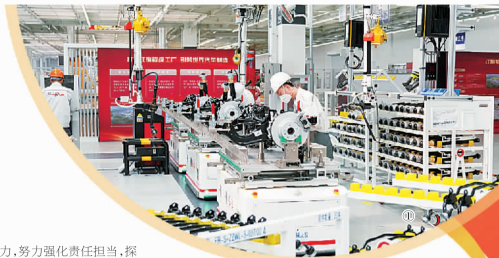
才赋力,努力强化责任担当,探索现代农业发展新路。

在提高口粮品质方面,吉林下足功夫。吉林大米、吉林鲜食玉米、杂粮杂豆品牌建设取得明显成效。“十四五”时期,吉林省把农产品及其深加工和食品细加工作为万亿元级产业目标予以重点打造,强化政策赋能、科技赋能、人