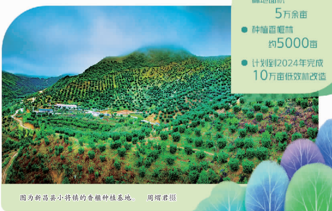
图为新昌县小将镇的香榧种植基地。

通过香榧助农增收，需要长效机制。新昌确定了“土地流转、资源入股、平台开发、规模经营、金融扶持、期权兑现、强村富民”的闭环运行机制，把闲置资源转化为优质资产，让农民成股民，资金成股金，实现“存进绿水青山、取出金山银山”。