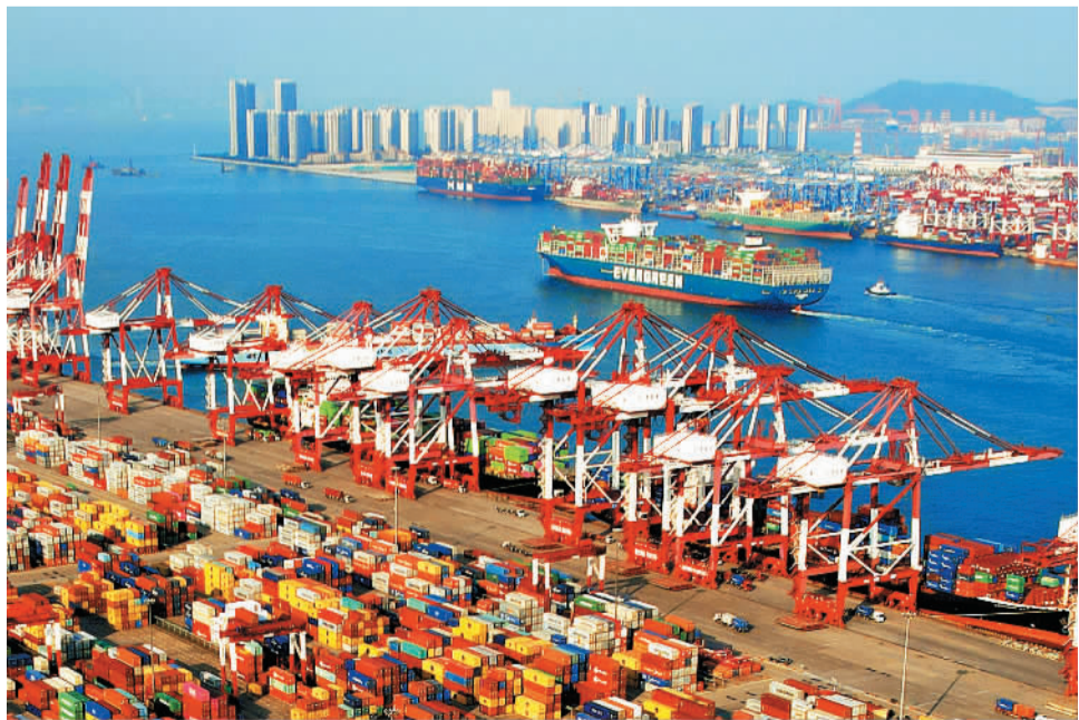
7月18日，山东港口青岛港前湾集装箱码头车船如织，整个港区十分繁忙。今年以来，青岛港依托山东港口一体化发展平台，积极开拓海外市场，航线不断丰富和迭代，上半年新增航线15条，船舶靠离艘次同比增长4.39%。

“香榧产业绿色、生态、富民，是我们推动共同富裕、实施乡村振兴战略的新亮点，也是实现农民增收的新途径，一定要做大做强这个产业。”新昌县委书记黄旭荣说。