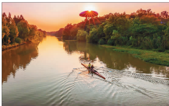
▼游客划着小船穿行在杭州西溪国家湿地公园，感受人与自然和谐相处的亲密与怡然。