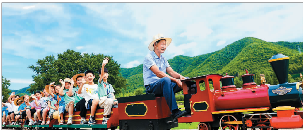
▲小学生在安吉县余村体验田园小火车。近年来，当地坚持不懈复垦复绿旧矿山，并大力发展第三产业，形成了可游可赏、亦耕亦采的新型乡村生态经济。