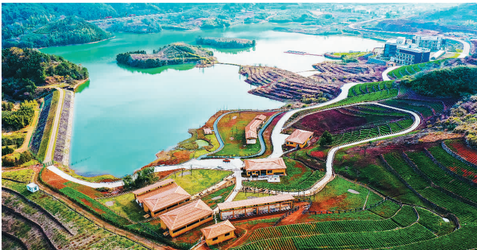
7月22日,正在建设中的浙江细胞科技园一角。该产业园位于浙江省嵊州市长乐镇,建成后将成为重要的mRNA和纳米抗体生产研发中心。近年来,嵊州市不断优化产业结构,大力发展生物医药产业,推动经济多元化发展。

同时,北海市全力帮助工业企业渡难关、保生产,为产业链供应链安全稳定和畅通运行提供坚强保障。据统计,7月12日以来,有1万余辆物流车进出铁山港(临海)工业区,有效地保障了企业产品和原料运输。同时,成立物资保障专班,安排网格员逐一对应辖区77家企业,特别是对重点工业企业由专人跟踪服务,及时掌握企业生产动态及存在问题,第一时间协调解决。