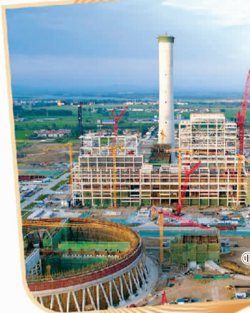
图① 湖北襄阳(宜城)火电项目正加紧建设。

湖北宜昌,长江畔。兴发集团新材料产业园内,近千米滨江绿地取代了原来的厂房。这里曾经是黄磷厂和沿江码头,“化工围江”直接威胁长江生态安全。破解“化工围江”,宜昌率先打响雷霆之战:3年里,沿江1公