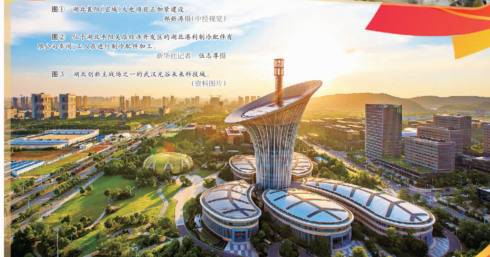
图③ 湖北创新主战场之一的武汉光谷未来科技馆。(资料图片)