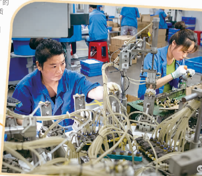
图② 位于湖北襄阳吴店经济开发区的湖北港利制冷配件有限公司车间,工人在进行制冷配件加工。