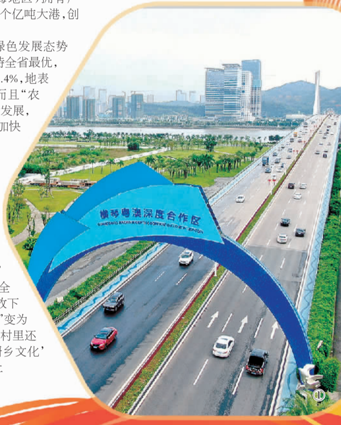
图① 位于广东自贸区的珠海横琴大桥。

根据规划，茂名在“十四五”期间将围绕东华能源烷烃资源综合利用项目，积极拓展上下游产业链，打造世界级绿色化工和氢能产业园。到2035年，工业园区将达到约1000万吨三烯产能，每年为下游产业提供150万吨丙烯、200万吨乙烯、30万吨氢气等基础化工原料，形成具有自主研发能力和竞争优势的万亿级产业集群。