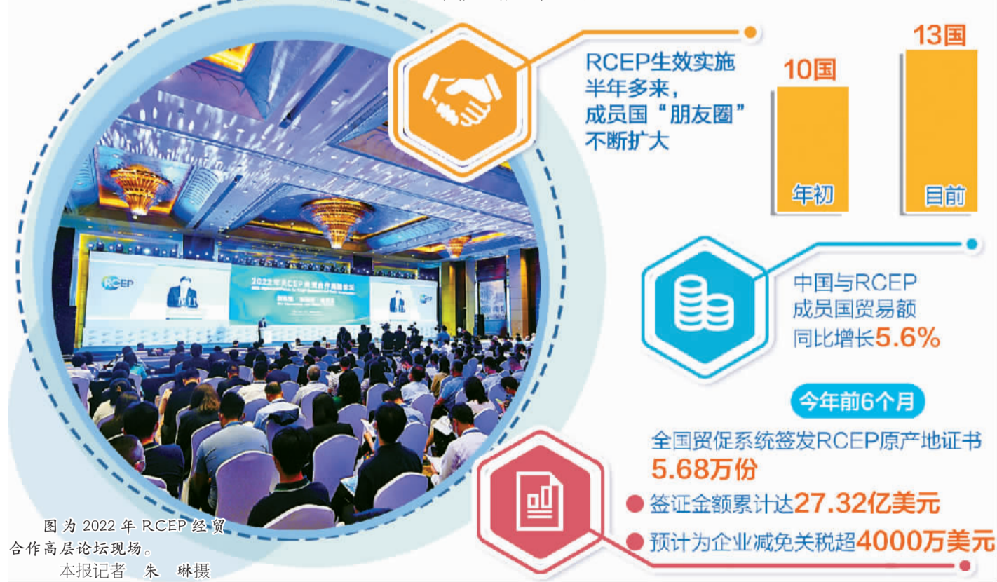
图为2022年RCEP经贸合作高层论坛现场。

国与RCEP成员国的贸易额同比增长5.6%。今年前6个月,全国贸促系统签发的RCEP原产地证书达5.68万份,签证金额累计达27.32亿美元,预计为企业减免关税超过4000万美元。