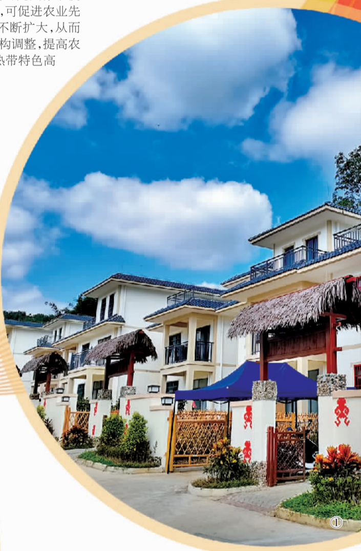
图① 保亭黎族苗族自治县雅布伦享水谷共享农庄。