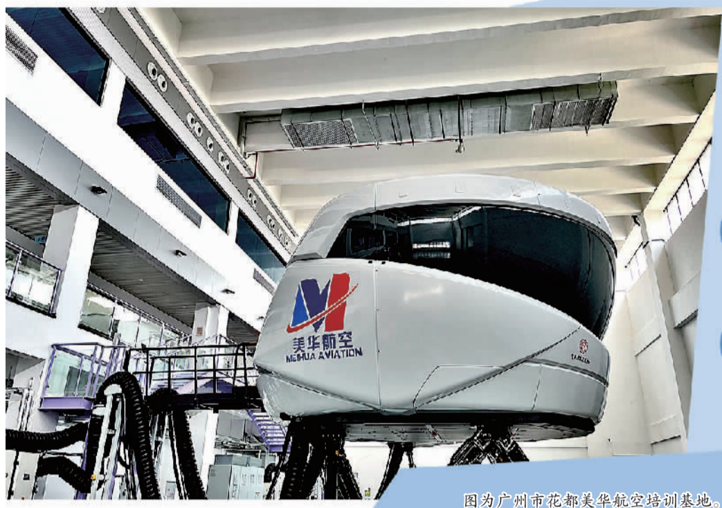
图为广州市花都美华航空培训基地。

花都区委书记邢翔说，全区将共建高水平对外开放门户，着力构建南有海港、北有空港的世界级交通枢纽体系。飞机、高铁加上现有的花都港、高速干道，花都已初步建成水陆空一体的全方位多元立体交通体系，吸引全球的资金、资源、人才、技术向这里汇聚，真正实现“人便于行，物畅其流”。