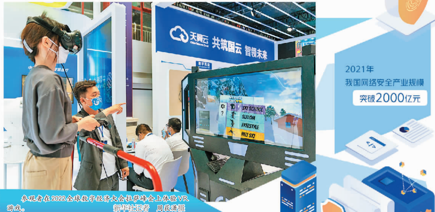
参观者在2022全球数字经济大会拉萨峰会上体验VR游戏。

我国正进入数字化转型、智能化升级的关键时期,对安全大脑、人工智能安全、后量子加密等数字安全技术的需求与日俱增。樊