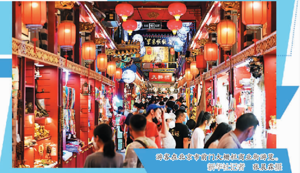
游客在北京前门大街栅栏商业街游览。