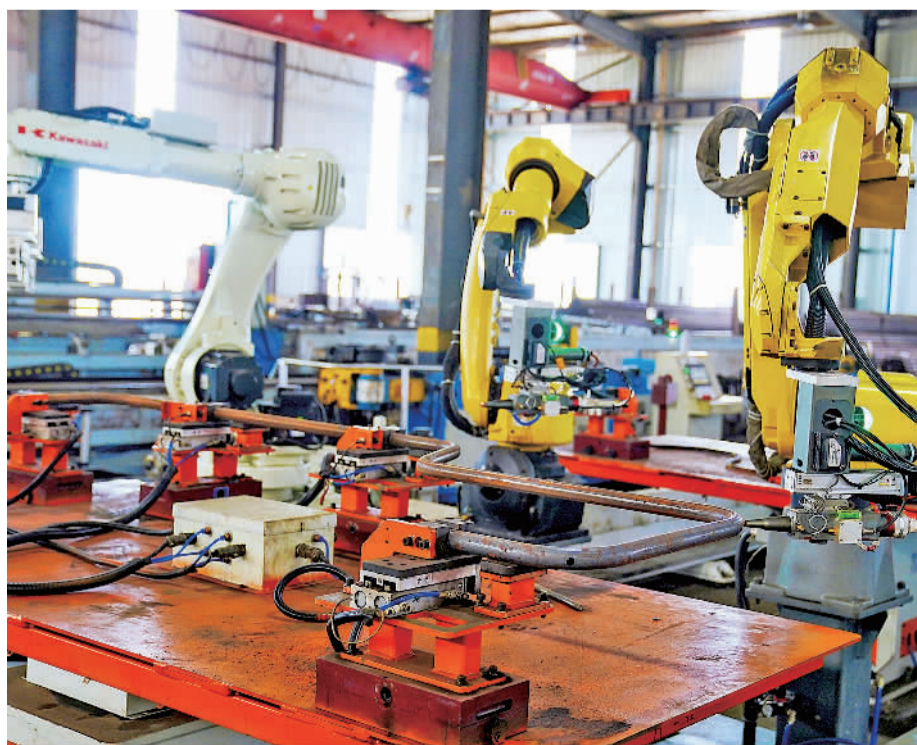
近日，江西增鑫科技股份有限公司焊装生产车间，机械臂在进行自动焊接作业。今年以来，江西做强做优数字经济“一号工程”，大力实施制造业智能升级，围绕5G应用、工业互联网等新兴领域布局建设一批“智能工厂”“数字化车间”，推动产业转型升级。

陕西省学生资助事务中心负责人表示，开学前后是诈骗高发期，学生和家长一定要提高警惕，增强风险意识，有问题及时通过教育部门和高校等渠道咨询，谨防被骗，避免造成损失。