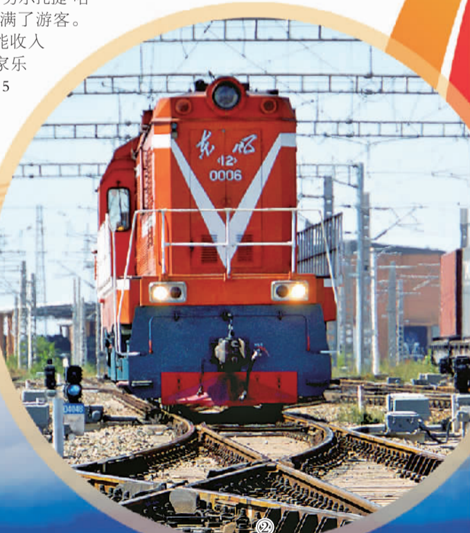
图① 新疆库车市举行醉美杏花节活动，市民们一同观赏杏花，踏青游园。 图② 在霍尔果斯站，调车机正在进行班列编组作业。今年7月，霍尔果斯铁路口岸单月过货量达101.6万吨，单月过货量自建站以来首次突破百万吨大关。 图③ 新疆巴音布鲁克草原。

旅游经济是典型的开放型经济，是一个地区开放水平的重要标志。新疆在迈向对外开放前沿的同时，加快对内开放，日益繁荣的旅游经济，成为这块广袤的西北内陆将区域性开放战略纳入国家向西开放的总体布局、深化双向开放的生动注脚。