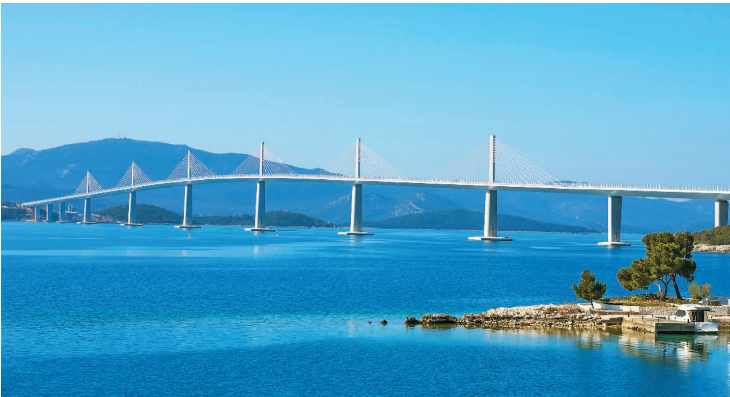
图为横跨克罗地亚南部亚德里亚海小斯通湾的佩列沙茨大桥。