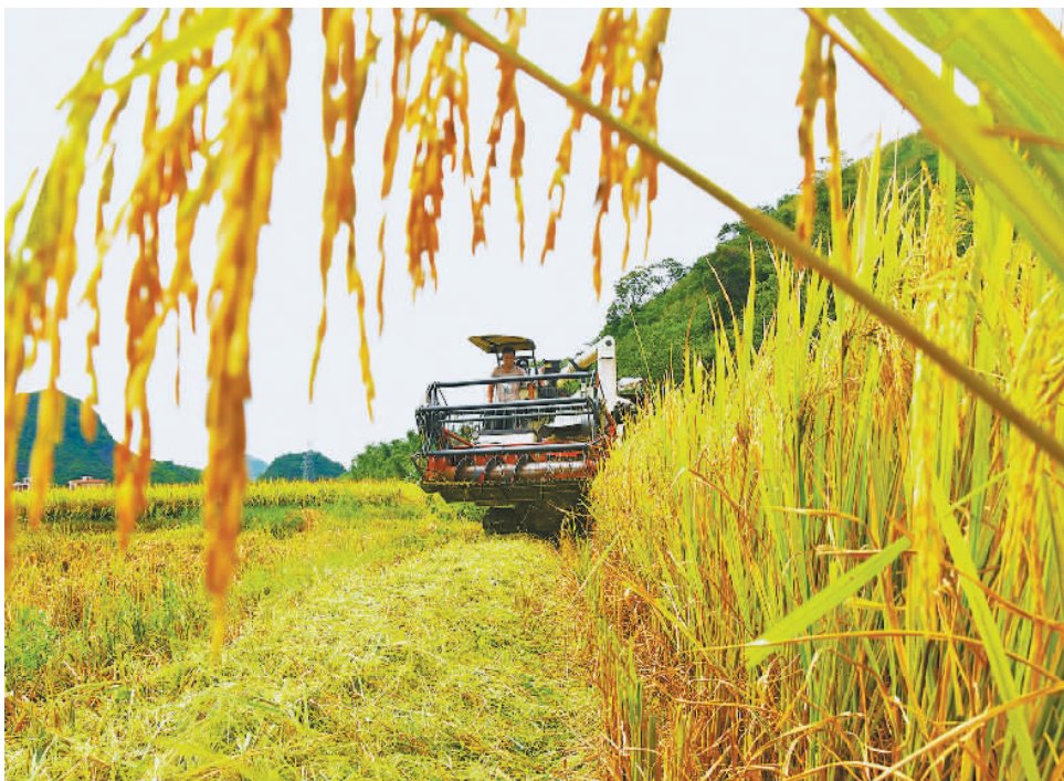
湖南江永县松柏瑶族乡风田村的农民驾驶农机收割中稻。当前，江永5.3万亩中稻陆续成熟，农民利用晴好天气加紧抢收，确保颗粒归仓。

对游客自身来说，出游时也要对旅游景区或旅游项目的安全性有基本了解，同时严格遵守景区的安全规定，对于一些未经开发的区域要谨慎前往，最大限度保护好自身安全。