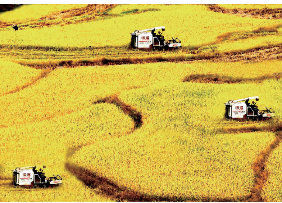
8月14日,正是再生稻丰收期,江西省宜春市潭山镇店上村村民利用晴好天气,驾驶收割机抢收抢割,确保颗粒归仓。近年来,该县紧盯市民“米袋子”和农民“钱袋子”,大力实施粮食稳产与提质工程,积极调整粮食种植结构,在稳定双季稻面积的基础上,大力推广再生稻种植,促进粮食增产、农民增收。据统计,今年该县再生稻种植面积达10万亩,预计总产量达6000万斤。