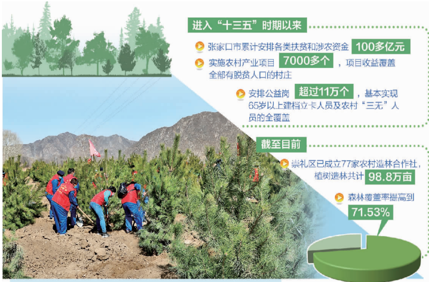
张家口市崇礼区以工代赈公益岗春季植树现场。(资料图片)

康保县委书记李军告诉记者:“按照有利于国家大局、有利于乡村发展、有利于困难群众就业增收的要求,我们在出台村级公益性岗位设置方案的同时,配套制定了一系列相关制度,明确岗位类型、开发数量、上岗条件等。重点在围绕激发群众内生动力上下功夫,既要让群众明白‘惠从何来、惠在何处’,又要在公益岗设置中推行绩效考核、差异分配,防止简单发钱、养懒汉。”