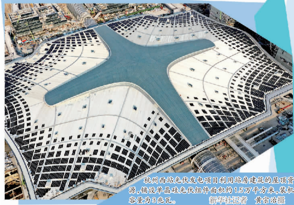
杭州西站光伏发电项目利用站房建筑的屋顶资源,铺设单晶硅光伏组件面积约1.5万平方米,装机容量为3兆瓦。

同时,推行“窄马路、密路网、小街区”,县城内部道路红线宽度不超过40米,广场集中