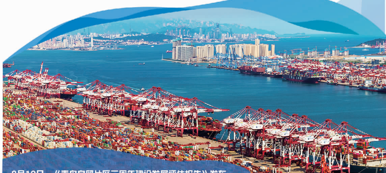
8月19日,《青岛自贸片区三周年建设发展评估报告》发布