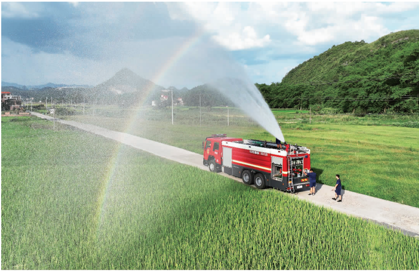
8月23日,湖南省道县寿雁镇深田村,消防救援队员帮助农户进行水稻抗旱浇灌。连日来,当地持续高温,各部门积极行动,采取持续加大农田水利灌溉力度、人工降雨、清淤疏浚、引水抗旱等措施抗旱保苗,促秋粮丰收。

据悉,“十四五”时期,浙江在交通设施领域安排的重大实施类建设项目最多。总投资上,现代产业领域最高,59个项目共计投资22402亿元,在“十四五”计划投资中的占比最高,为31.9%。重点是聚力数字经济、生命健康、新材料等新兴产业,聚力绿色石化、现代纺织、汽车等支柱产业,聚力第三代半导体、柔性电子、氢能等未来产业,推进一批打基础、利长远的重大项目建设,以浙江的稳和进为全国大局作贡献。