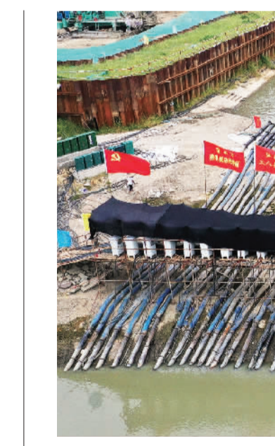
内蒙古包头市稀土产业园区建设现场,工人们正在紧张施工。

疫情是当前全球经济增长最大的不确定因素之一。须看到,疫情对各国经济社会都会造成一定影响,病毒才是拖累经济的罪魁祸首,不同的防控策略和措施对减少和控制负面影响存在着差别,关键要算大账、长远账、动态账。事实证明,越是坚持动态清零,疫情就能越早得到控制,经济社会发展受到的影响就越小。我国的防疫措施是最经济、效果最好的。当前,疫情防控形势复杂严峻,国内改革发展稳定任务艰巨繁重,我们必须坚持“动态清零”的总方针不动摇,高效统筹疫情防控和经济社会发展工作,力争实现疫情防控和经济社会发展双胜利。