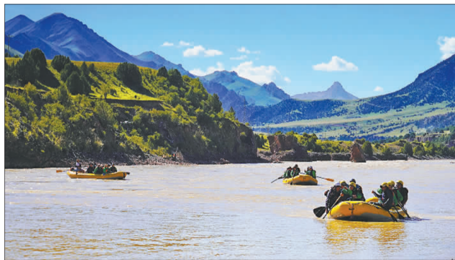
▼游客在昂赛大峡谷体验漂流。昂赛乡成为三江源国家公园内第一个开展生态体验特许经营活动的试点,从无名小镇一跃成为游客生态体验的打卡地。