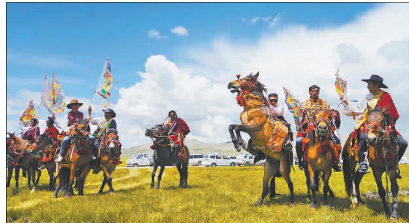
▲杂多县查旦乡牧民用民族传统马术表演迎接远道而来的宾客。