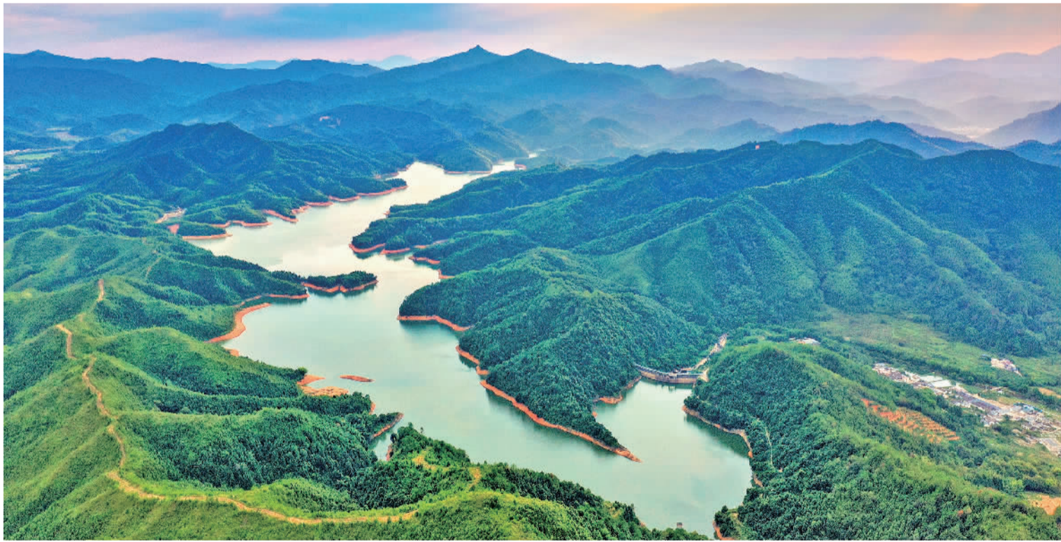
9月6日，航拍江西省全南县黄云水库，青山绿水风景如画。该水库地处桃江左岸支流，坝址以上控制流域面积93.7平方公里，兼具灌溉、养殖、发电、生态涵养功能。近年来，当地常态化开展水系保洁、水质监测，水库综合功能得以充分发挥。

当前，影响我国外汇储备波动的主要因素依然是汇率和资产价格变化。民生银行首席经济学家温彬认为，从汇率因素看，8月末美元指数受能源供需紧张、通胀压力增大、美联储加息预期等因素推动，较7月末上涨2.69%，非美元货币中，欧元下跌1.68%，英镑下跌4.54%，日元下跌4.13%。综合看，汇率因素导致外汇储备的非美元部分出现较大幅度折价。从资产价格因素看，8月中旬美联储加息预期升温，导致全球市场由