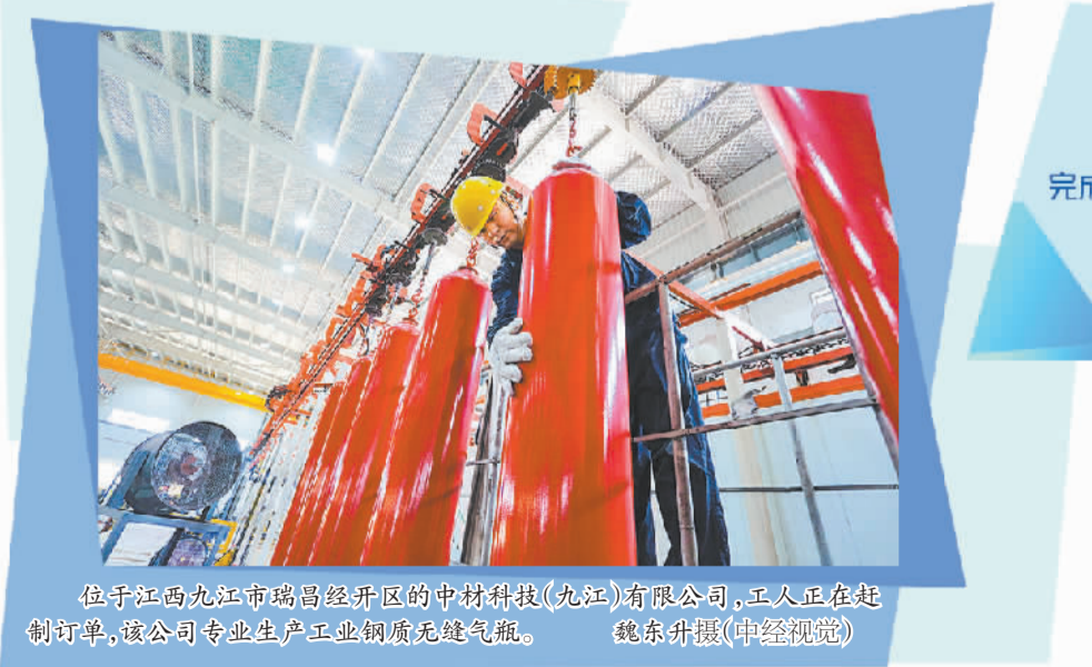
位于江西九江市瑞昌经开区的中材科技(九江)有限公司,工人正在赶制订单,该公司专业生产工业钢质无缝气瓶。

高效。国有控股上市公司是国有企业的主体,通过深化改革进一步搞好上市公司,发挥好示范引领作用,意义重大。