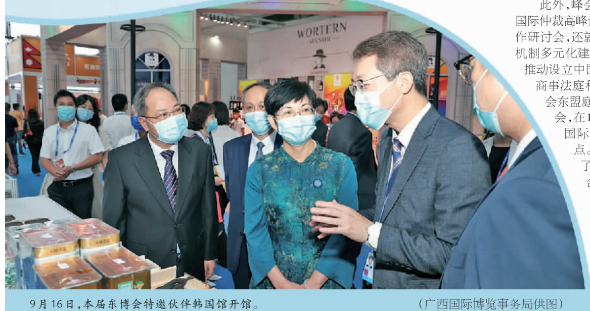
9月16日,本届东博会特邀伙伴韩国馆开馆。