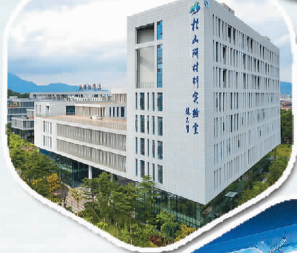
松山湖材料实验室