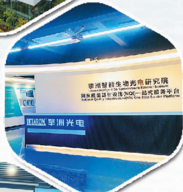
东莞市孚洲光电企业质量基础设施“一站式”服务平台