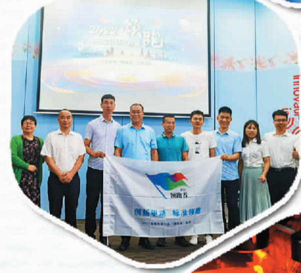
举办2022年以高标准引领高质量全国企业标准“领跑者”主题沙龙活动