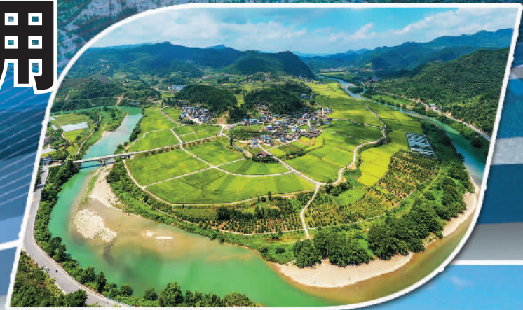
贵州黔东南州岑巩县支行信贷支持的杂交水稻“育繁推”一体化项目基地