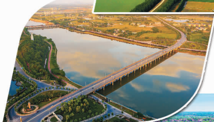
湖南宁乡市支行信贷支持的经开区污水综合治理一期项目