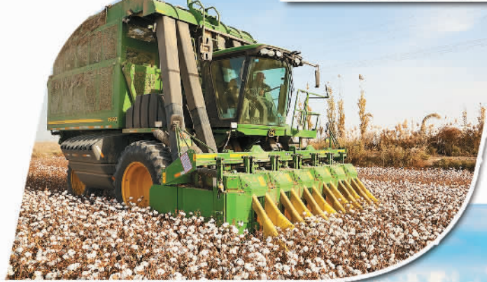
新疆阿克苏沙雅县支行信贷支持的农村基本农田流转项目