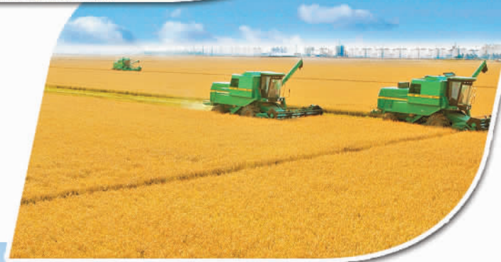
黑龙江佳木斯建三江支行信贷支持的企业机械化收割作业场景