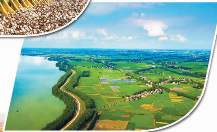
湖北荆州监利县支行信贷支持的长江防护林项目