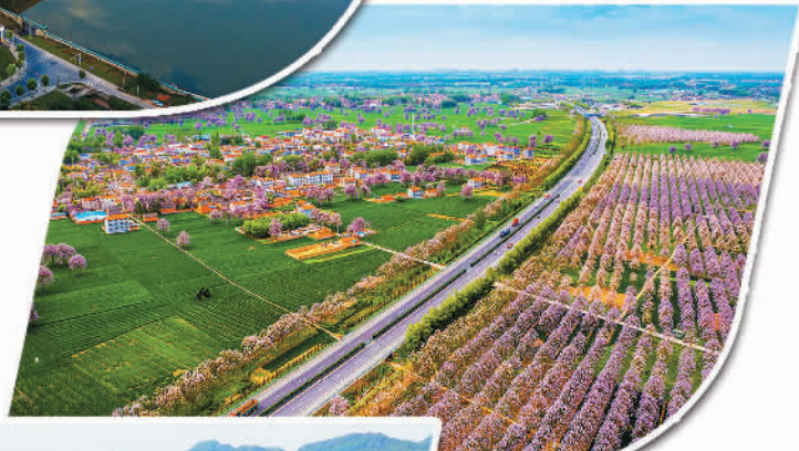
河南开封兰考县支行信贷支持的国家储备林项目