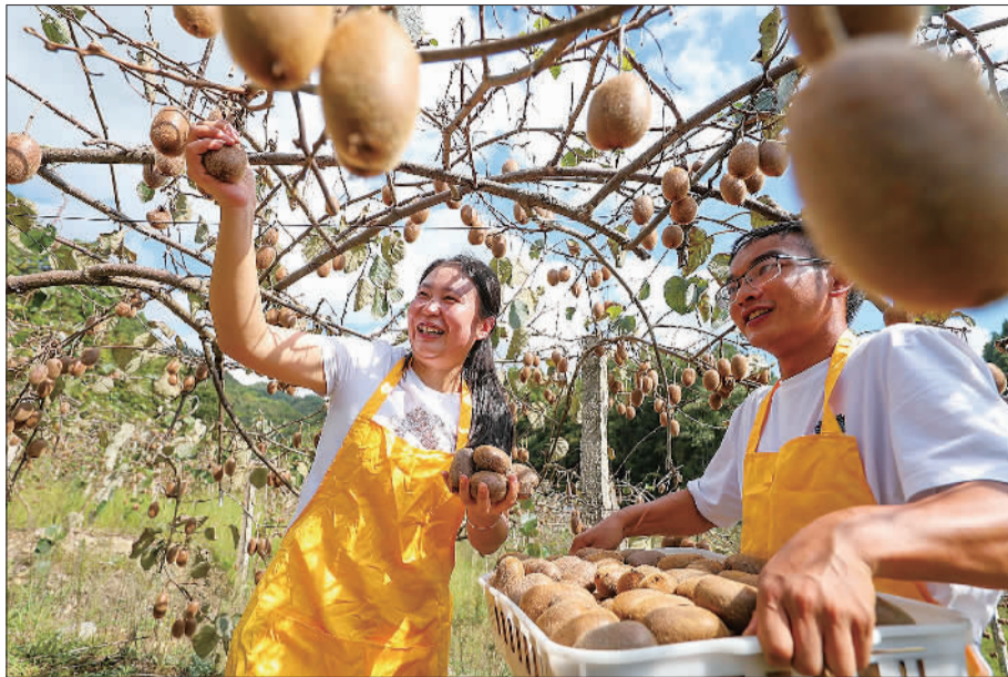
▲10月3日,果农在贵州省岑巩县平庄镇包东村猕猴桃种植基地忙采摘,抢抓国庆消费季,确保市场供应。