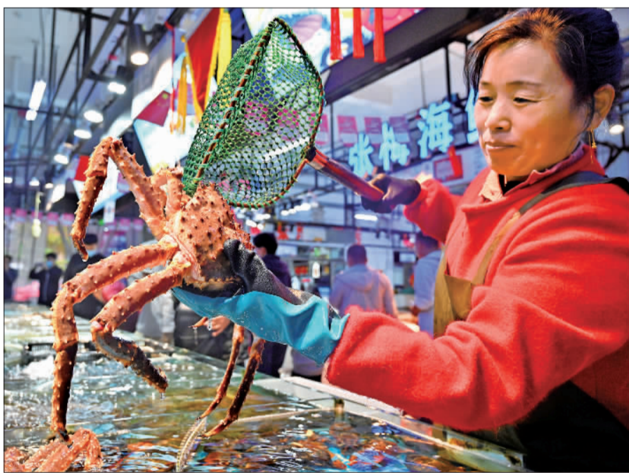
▲10月4日,在山东省日照市东港区石臼海鲜市场,工作人员在给顾客捞帝王蟹。国庆假日,该市海产品货源充足,价格平稳。