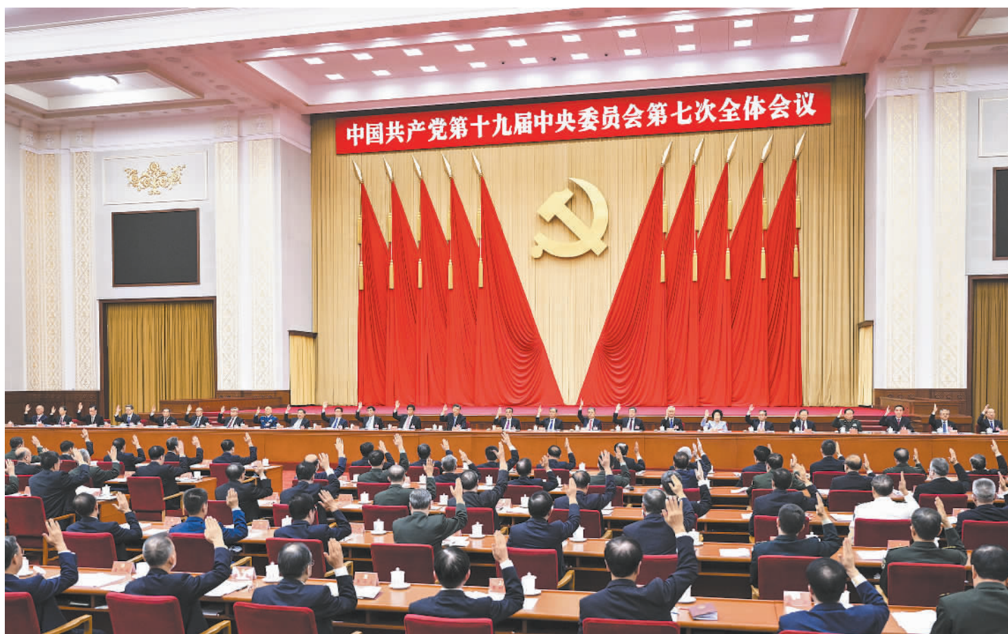
中国共产党第十九届中央委员会第七次全体会议,于2022年10月9日至12日在北京举行。中央委员会总书记习近平作重要讲话。新华社记者 鞠鹏摄