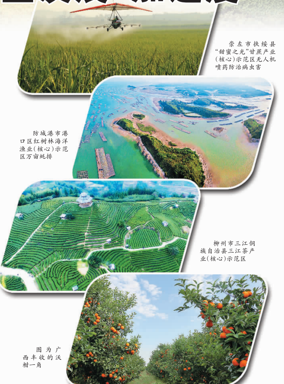
崇左市扶绥县“甜蜜之光”甘蔗产业(核心)示范区无人机喷洒防治病虫害