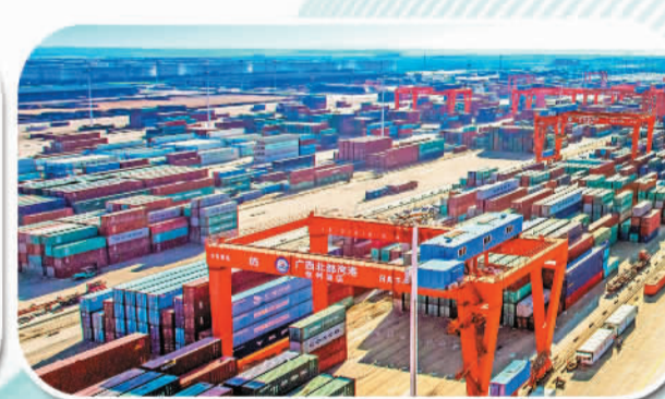
北部湾港开启通航30万吨级巨轮的历史,2021年集装箱吞吐量突破600万标箱。图为钦州港国际集装箱码头