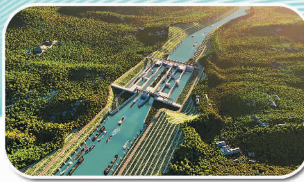
2022年8月28日,“世纪工程”平陆运河开工建设。平陆运河是西部陆海新通道的牵引性工程,建成后将以较短距离开辟西江干流入海新通道,释放航运优势和潜力。图为平陆运河效果图