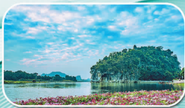
漓江生态保护取得显著成效,广西山清水秀生态美金字招牌更加闪亮。图为象鼻山景区