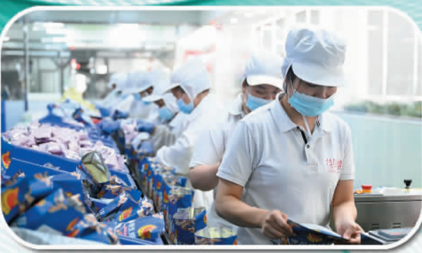
小米粉做成了大产业。位于柳州市柳南区的柳州螺蛳粉生产集聚区内,工人们在包装袋装螺蛳粉