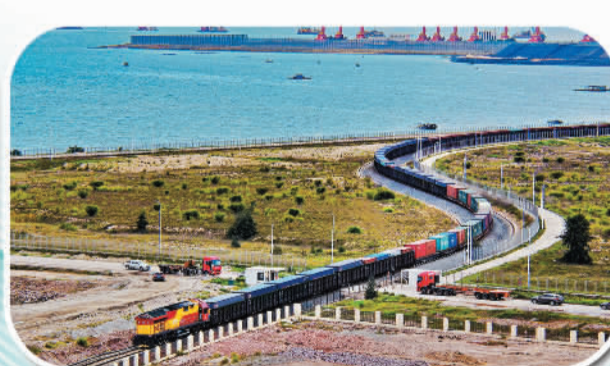
西部陆海新通道上升为国家战略,建设全面提速。图为钦州港东站开往西部陆海新通道班列