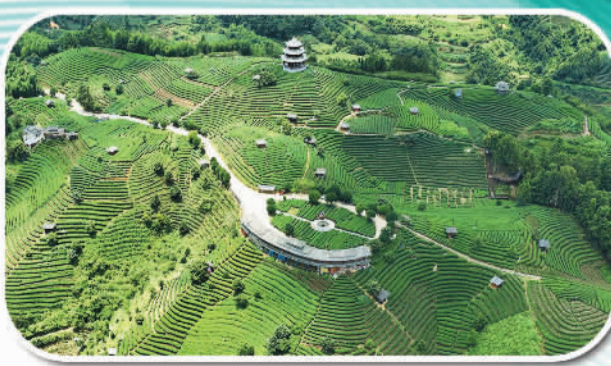
乡村振兴全面推进,特色产业提质增效。图为三江侗族自治县布央仙人山景区