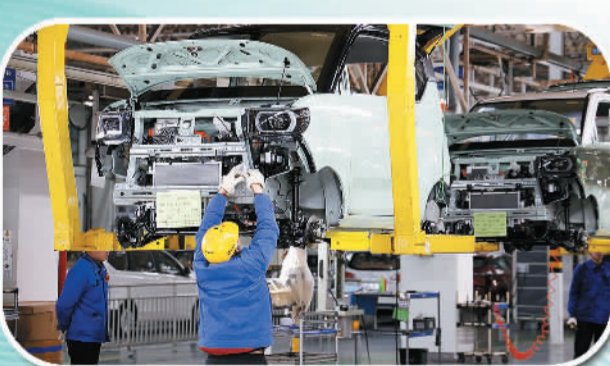
广西形成10个千亿级工业产业集群。图为上汽通用五菱公司河西基地总装西部车间