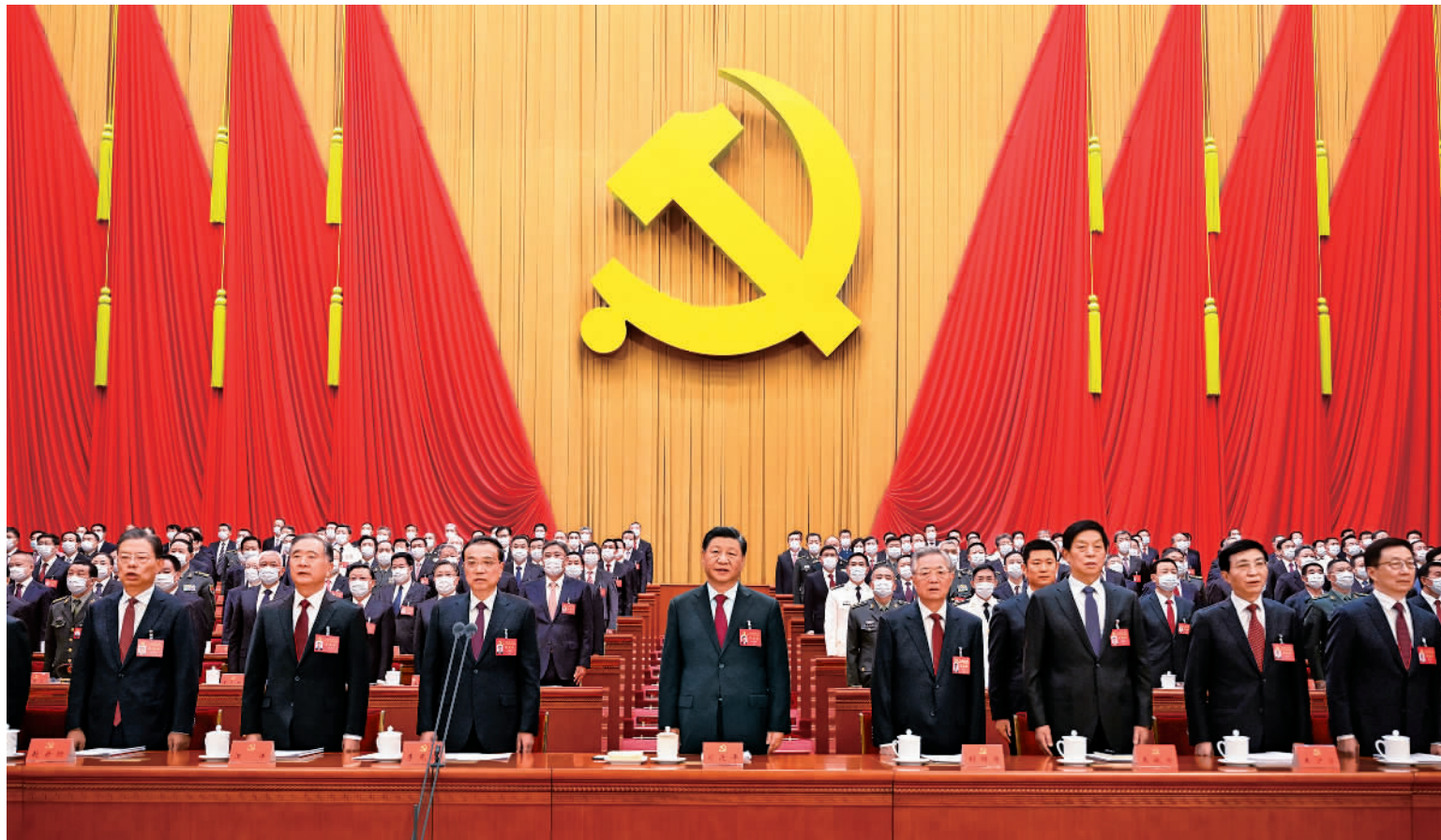
10月16日，中国共产党第二十次全国代表大会在北京人民大会堂开幕。习近平代表第十九届中央委员会向大会作报告。