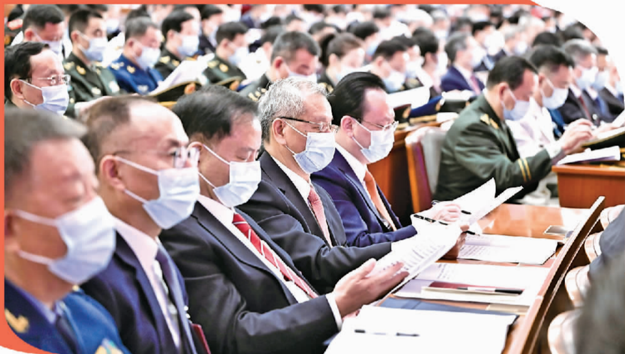
10月16日,中国共产党第二十次全国代表大会在北京人民大会堂开幕。

党的二十大报告提出,十年来,我们采取一系列战略性举措,推进一系列变革性实践,实现一系列突破性进展,取得一系列标志性成果,经受住了来自政治、经济、意识形态、自然界等方面的风险挑战考验,党和国家事业取得历史性成就、发生历史性变革,推动我国迈上全面建设社会主义现代化国家新征程。提出并贯彻新发展理念,着力推进高质量发展,推动构建新发展格局,实施供给侧结构性改革,制定一系列具有全局性意义的区域重大战略,我国经济实力实现历史性跃升。