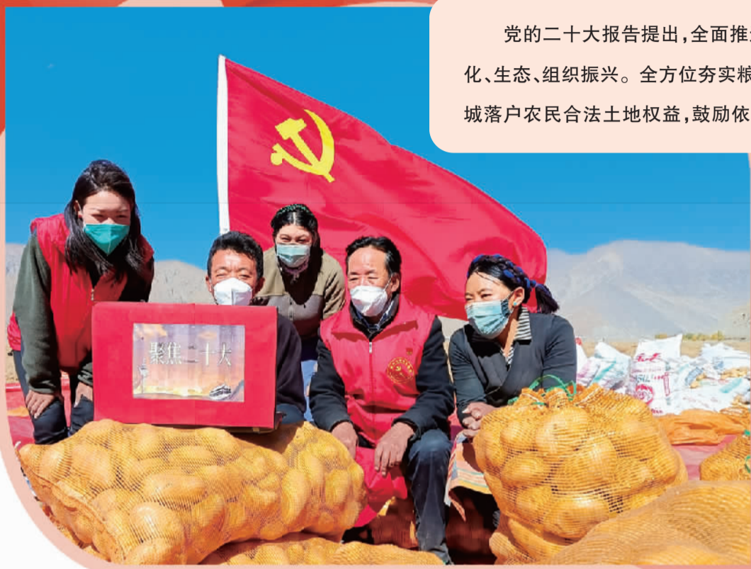
西藏日喀则税务局驻南木林县卡孜乡藏雄村工作队队员和群众一起在田间地头收看党的二十大开幕会。

党的二十大报告提出,全面推进乡村振兴。坚持农业农村优先发展,坚持城乡融合发展,畅通城乡要素流动。扎实推动乡村产业、人才、文化、生态、组织振兴。全方位夯实粮食安全根基,牢牢守住十八亿亩耕地红线。深化农村土地制度改革,赋予农民更加充分的财产权益。保障进城落户农民合法土地权益,鼓励依法自愿有偿转让。