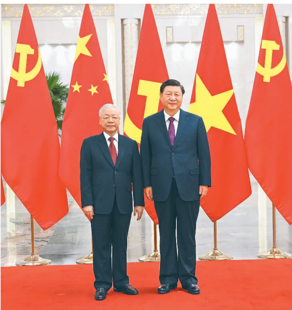
左图 10月31日,中共中央总书记、国家主席习近平在北京人民大会堂同越共中央总书记阮富仲举行会谈。这是会谈前,习近平在人民大会堂北大厅为阮富仲举行欢迎仪式。