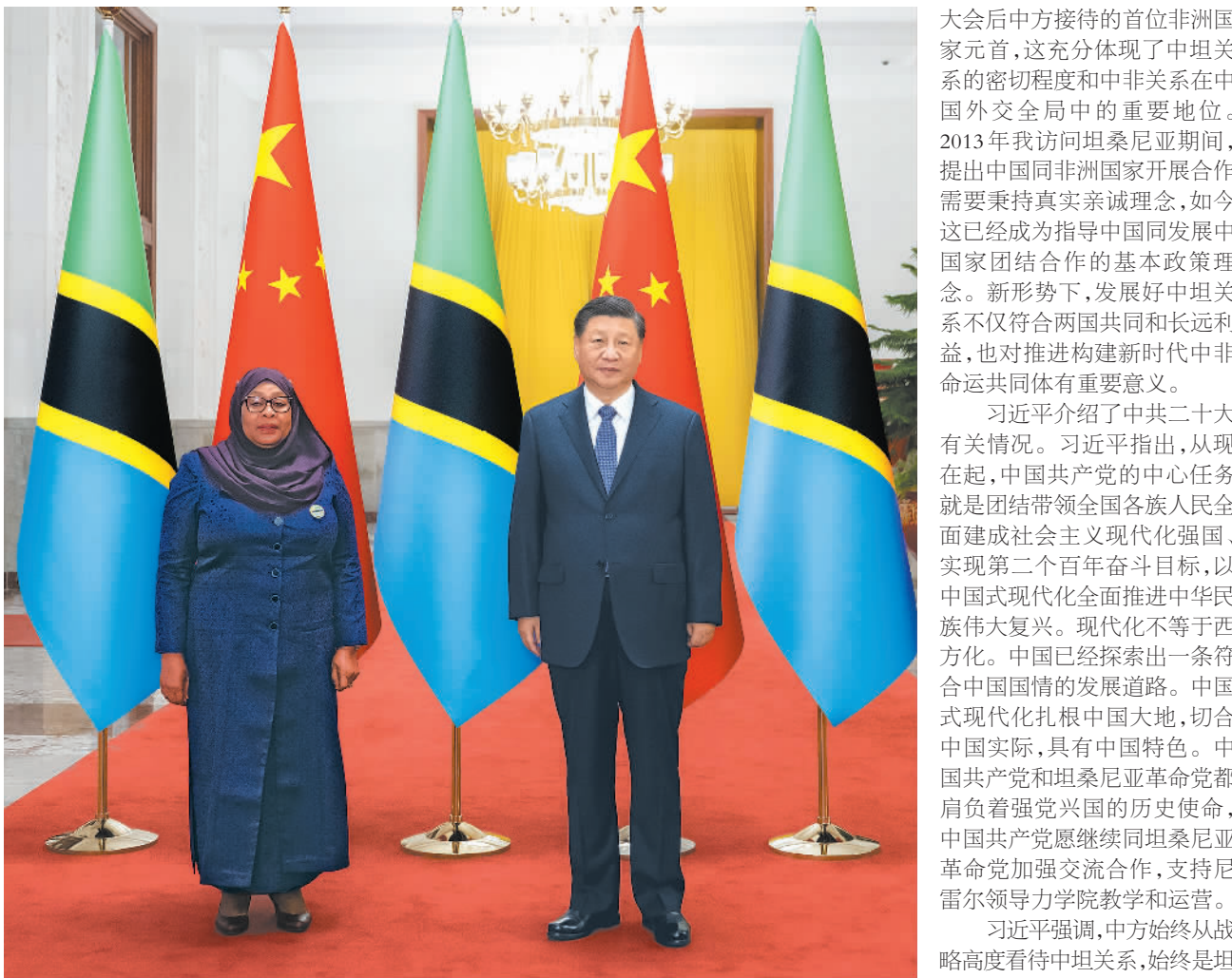
11月3日下午,国家主席习近平在北京人民大会堂同来华进行国事访问的坦桑尼亚总统哈桑举行会谈。这是会谈前,习近平在人民大会堂北大厅为哈桑举行欢迎仪式。

新华社北京11月3日电 国家主席习近平11月3日下午在人民大会堂同来华进行国事访问的坦桑尼亚总统哈桑举行会谈。两国元首宣布,将中坦关系提升为全面战略合作伙伴关系。习近平指出,哈桑总统是中国共产党第二十次全国代表