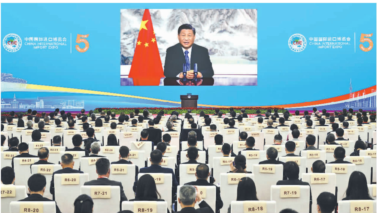
下图 11月4日晚,国家主席习近平以视频方式出席在上海举行的第五届中国国际进口博览会开幕式并发表题为《共创开放繁荣的美好未来》的致辞。

新华社北京11月4日电 11月4日晚,国家主席习近平以视频方式出席在上海举行的第五届中国国际进口博览会开幕式并发表题为《共创开放繁荣的美好未来》的致辞。