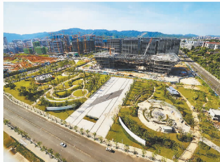
建设中的经开区文体中心