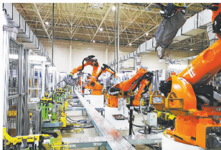
江铃新能源智能制造生产线

不只是慈文传媒的人驻,围绕持续做优做强数字经济“一号发展工程”,经开组团脚步未曾停歇——陆续引进赣鄱数据湖、中国